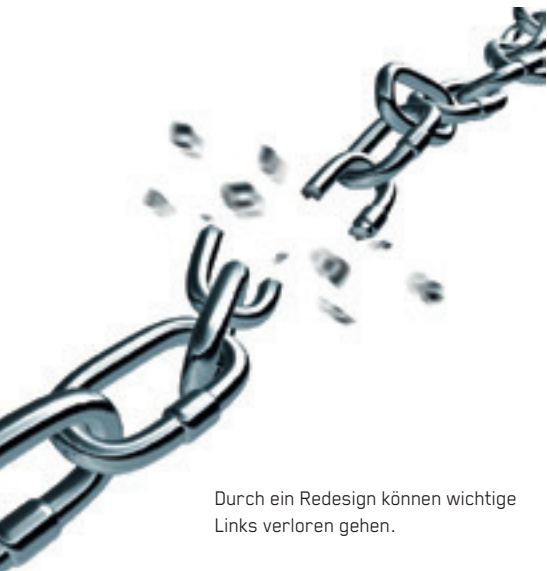
Durch ein Redesign können wichtige Links verloren gehen.

Gerade dieser letzte Hinweis mag komisch klingen. Doch Google kann tatsächlich misstrauisch werden, wenn nebst dem Design einer Webseite z.B. auch der Domainname und der Besitzer ändern und die Inhalte stark überarbeitet werden. Dann sagt sich Google nämlich, dass bisherige Links, also Empfehlungen, die eine Seite erhalten hat, auf die neue Seite gar nicht mehr zutreffen. Und so kann es passieren, dass Google die Links ignoriert, die Ihre bisherigen Positionen gesichert haben. Um dieses Problem zu umgehen, hat sich ein stufenweises Vorgehen bewährt, bei dem nicht alles auf einmal geändert wird.